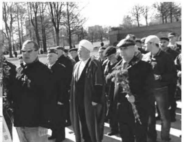
Пискаревское кладбище. Возложение венков, посвященное 67-ой годовщине Победы в Великой Отечественной войны.