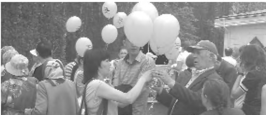
Праздник Великой Победы в мечети «Ляля-Тюльпан», г.Уфа

В годы войны работники ОАО «УМПО» совершили настоящий подвиг, не отходя от станков круглые сутки. Их силами было выпущено более 51 тысячи моторов для истребителей и бомбардировщиков конструкторов А.С. Яковлева, С.А. Лавочкина, В.М. Петлякова и других. На каждом третьем боевом самолете стоял уфимский двигатель, а самолет Як-9У с мотором ВК-107А признан самым быстрым истребителем Второй мировой.